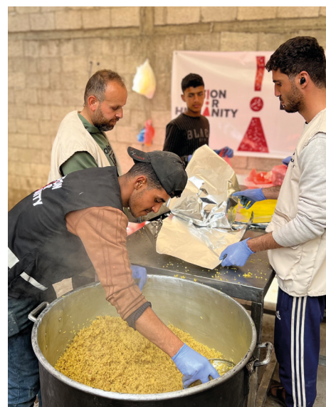
Stand: Februar 2025

Mit einer Spende ermöglichen Sie uns, weitere Familien aus Gaza, die nach Ägypten fliehen konnten, bei ihrer Integration zu unterstützen und helfen Ihnen, ein neues Leben aufzubauen.